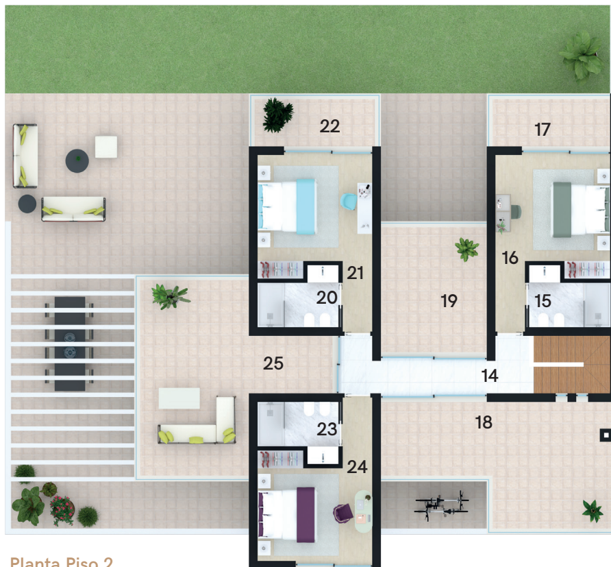
Planta Piso 2