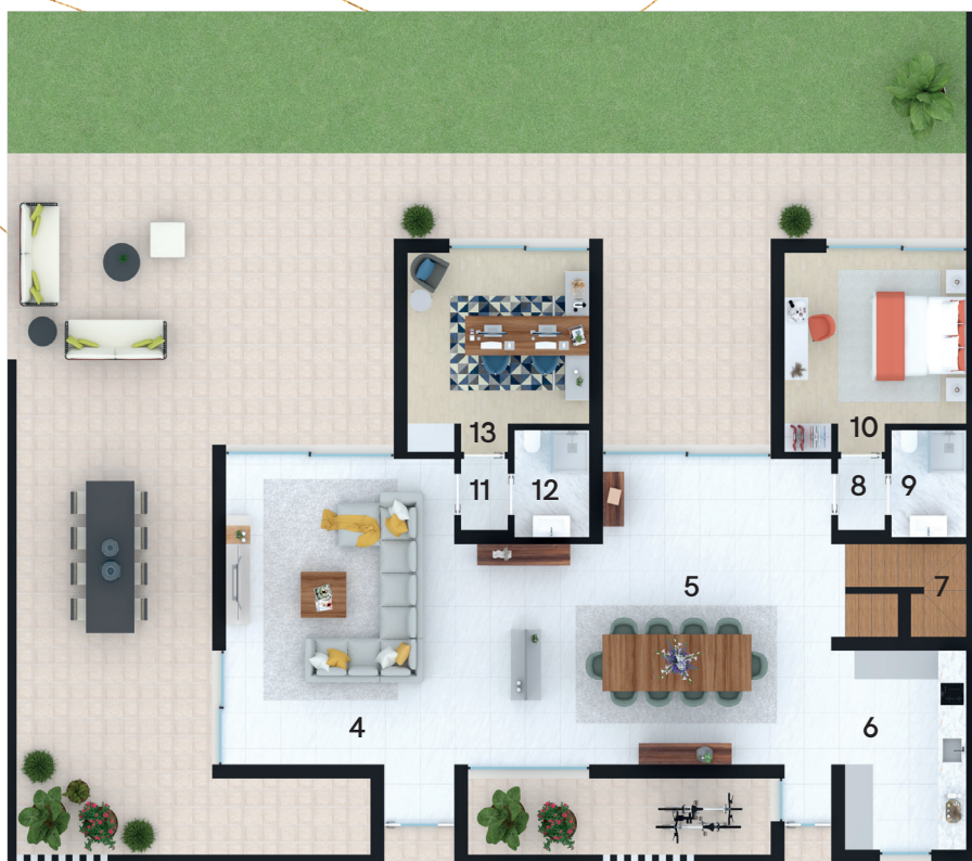
Planta Piso 1