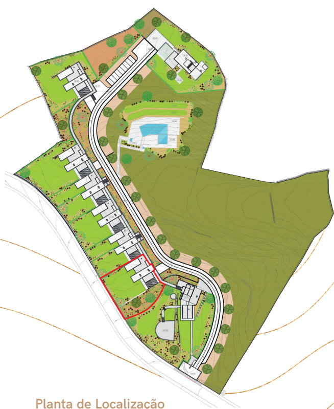
Planta de Localização